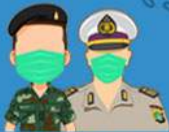
PETUGAS KEAMANAN DAN PERTAHANAN (TNI DAN POLRI)