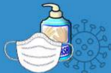
SARANA DAN PRASARANA