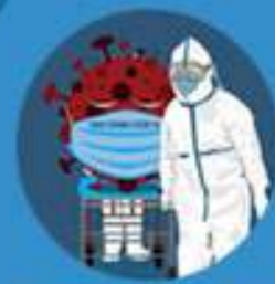
PETUGAS GUGUS PERCEPATAN PENANGANAN COVID-19