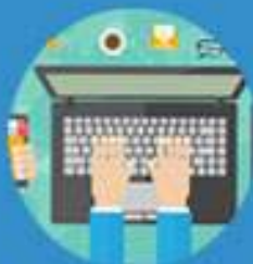
DATA DAN INFORMASI